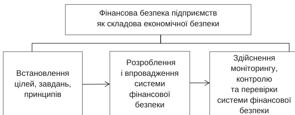
Рис. 1. Теоретичні засади формування фінансової безпеки підприємств