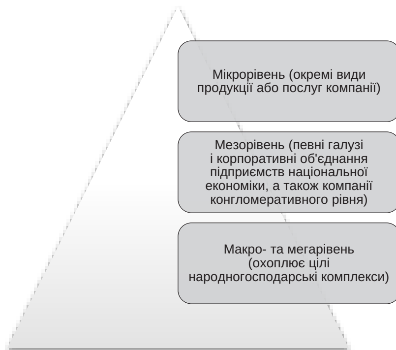
Рис. 1. Рівні конкурентної боротьби між суб'єктами ринку

На сучасному етапі вчені виділяють три базових рівні конкуренції між суб'єктами на ринку (рис. 1):