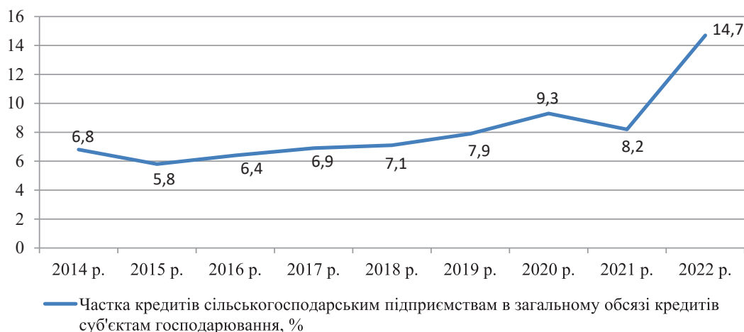
Рис. 1. Динаміка кредитів наданих сільськогосподарським підприємствам

Іншим важливим інструментом є податкові пільги. Зокрема, спеціальний режим оподаткування для аграрних підприємств у формі єдиного податку 4-ої групи спрощеної системи